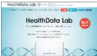
WEB制作 ヤフージャパン様