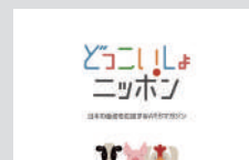
どこいしょニッポン