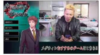
日本公認会計士協会様