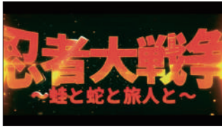
伊勢忍者キングダム様