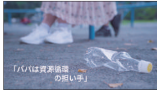
エコスタッフジャパン様