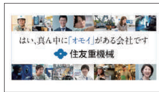
住友重機械工業様

大手ナショナルクライアントからスタートアップ、中小企業まで累計800件以上の問い合わせ・ご相談を受けております。あらゆる課題に即した最適なお提案をいたします。