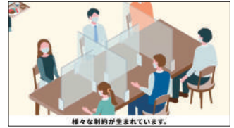
ボードウォーク様